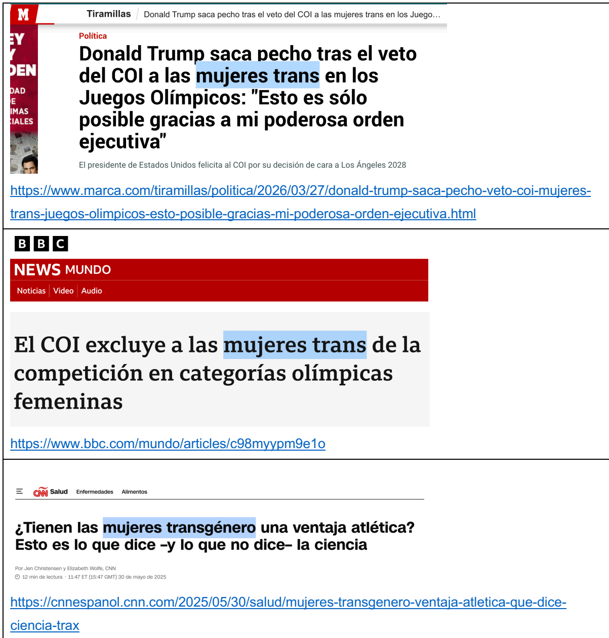
Figura 3. Captures de pantalla de la mateixa notícia en diferents mitjans, amb el terme "dona trans" ressaltat per facilitar la seva identificació. Data de les captures: 02/05/2026.

Pel que fa a la reclamació de "rectificar les informacions incorrectes", com ara "afirmar que els homes no podran competir més" RAC1 diu que no és cert perquè "podran competir al sexe que els correspon, que és el masculí". I explica que si donem un cop d'ull a la notícia, en cap cas diu que els homes no puguin competir, sinó que "el Comitè Olímpic Internacional ha decidit que només les persones nascudes amb genitals femenins podran participar en aquestes categories [les femenines]" i que "per tant, el COI prohibeix competir les dones transgènere", ja que la seva voluntat era fer-ho en categoria femenina.